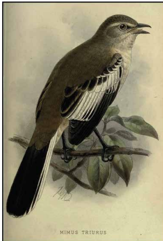
Imagen 2. Mimus triurus.

Es especial. Pensar que por esos lugares quizás pasó a caballo Hudson. Capaz no pasó ni de casualidad, ni cerca. Pero alguna relación hay y lo siento como algo especial en ese sentido. [...] Hudson habitó en las cercanías y es como una cuestión histórica, que marca una conexión con lo que hacemos.