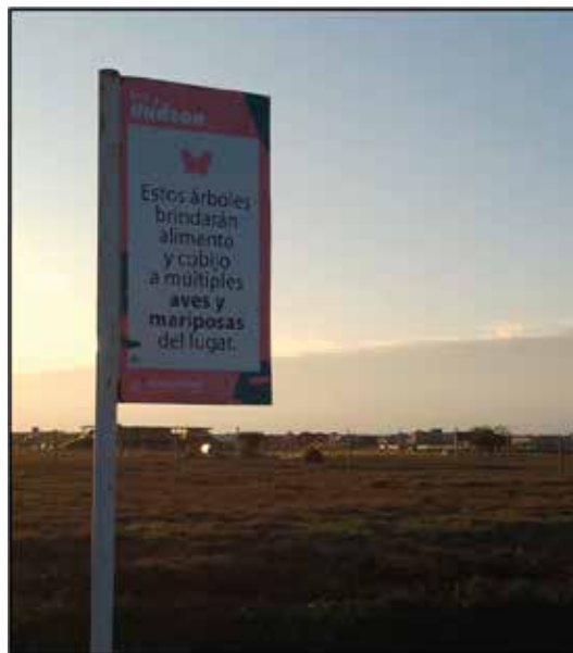
Imagen 3. Desmonte, cartel y barrio privado al fondo. Fotografía tomada personalmente (2023).

Tras el avance de las topadoras sobre miles de hectáreas de bosque, una fila de árboles entre los barrios y la calle de acceso —que hará de «cortina», según algunos pescadores y la población local crítica de estos emprendimientos—, es promovida mediante cartelera como «hábitat para las aves y mariposas del lugar» o como ejemplares que «serán plantas madres dispersoras de semillas», instando a protegerlos (Imagen 3).