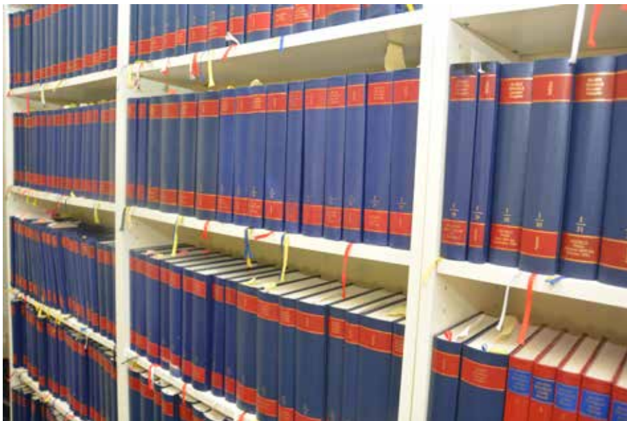
Figura 1. Volúmenes de la edición completa de Marx-Engels. MEGA.