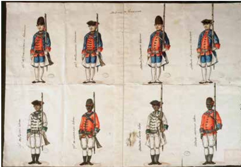
Figura 2. Diseño de uniformes de las compañías de milicias urbanas de blancos, pardos y morenos de Veracruz (AGI, MP-UNIFORMES,95)