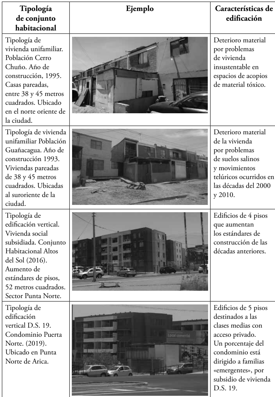
Cuadro 1. Tipología de conjuntos habitacionales, Arica