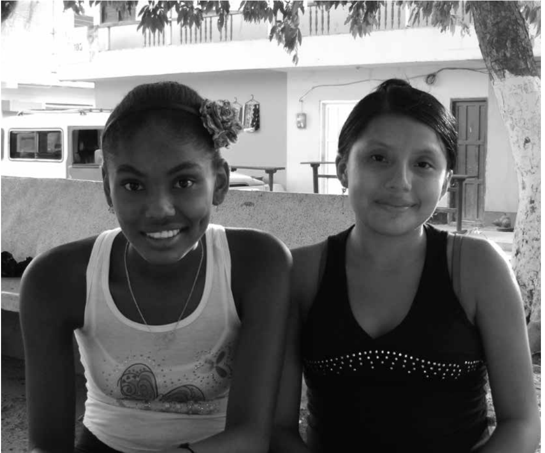
Unguia, 2015 Leonardo Montenegro