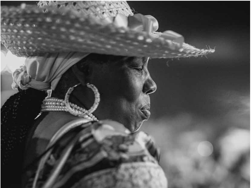
2014 - La mayora Xochilan Rojas