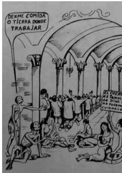
Figura 1. «Los cristianos y creyentes nos estamos reduciendo a las cuatro paredes del templo», ¡Escucha cristiano! p. 7, reproducida con el permiso de la Fundación del Sinú.

afrentado al pobre. Nos oprimen los ricos, y ¿no son ellos los mismos que os arrastran a los tribunales?... Si hacéis acepción de personas, cometéis pecados». El folleto tiene varias citas bíblicas de la carta de Santiago, ya que ésta resalta la necesidad de una justicia redistributiva, critica fuertemente la avaricia de los ricos, condena la diferencia entre la prédica y el comportamiento de algunas iglesias, y reconoce que la fe sin obras está muerta.