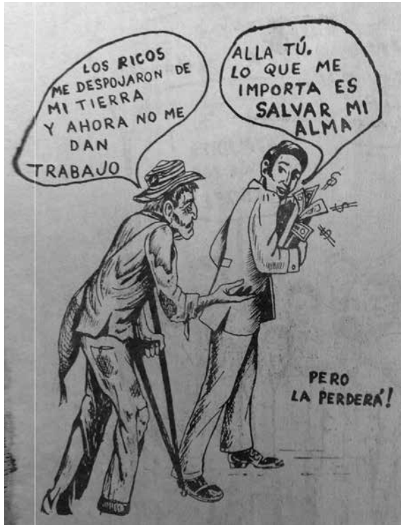
Figura 4. La lucha por la justicia, ¡Escucha cristiano! p. 14.

En otra imagen, en la página 5 del folleto, la dicotomía es más evidente, ya que los dibujos están enmarcados en un cuadrado dividido en dos por una diagonal (figura 5). En el triángulo superior, se puede observar a los campesinos trabajando fuertemente y llevando cargas pesadas, mientras que en el triángulo inferior, se ve a una persona descansando, con gran cantidad de comodidades y bolsas de dinero. Esta oposición da a entender que el hombre rico acumula sus capitales a costa de los campesinos explotados. Esta imagen está acompañada por un texto que dice «Por fortuna, DIOS ESTÁ JUZGANDO A ESTOS OPRESORES, A LOS RICOS Y A LOS PODEROSOS», y luego se lee una cita bíblica de la carta de Santiago 5:1-3, relacionada: «¡Veamos ahora ricos! Llorad y aullad por las miserias que os vendrán. Vuestras riquezas están podridas y vuestras ropas están comidas de polilla».