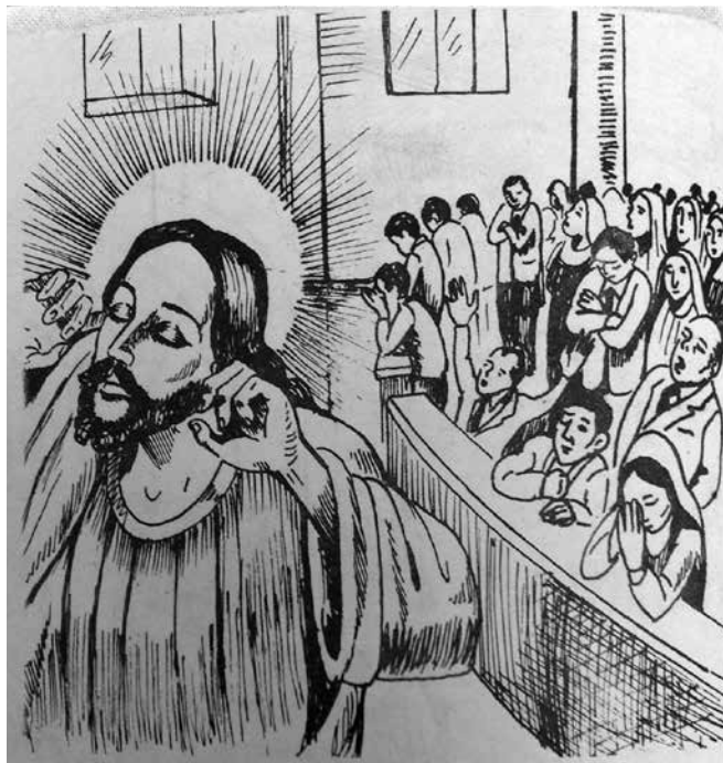
Figura 2. Cristo disgustado, ¡Escucha cristiano! p. 8, reproducida con el permiso de la Fundación del Sinú.

Segundo, con respecto a la idea de una doctrina fatalista entre los pentecostales del Retiro de los Indios, en otra de sus anotaciones, Salazar reconoce una resignación por parte de los creyentes, animada por su pastor, como si no fuera posible un cambio en sus vidas y en la sociedad. Por ejemplo, Salazar escribe la opinión del pastor sobre la lucha social: «los campesinos no van a cambiar, no sirve de nada buscar solución al problema de la tierra, mientras no lo hagan personas con Dios en el corazón. Los campesinos no trabajan porque no quieren. ¡Ah! Pero si se entregan [sic] a Cristo, serían diferentes y las cosas para ellos cambiarían» (CDRBR/M, fol. 0723: 4110). En la misma línea, transcribe las palabras de varios creyentes: «los campesinos son pobres porque no quieren trabajar, no buscan trabajo, son perezosos» (CDRBR/M, fol. 0723: 4110).