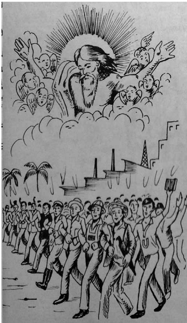
Figura 6. «Porque vosotros, hermanos, a la libertad fuisteis llamados», ¡Escucha cristiano! p. 11.

teología neoescolástica de las décadas pasadas, que reflexionaban sólo sobre temas metafísicos y atemporales. Seis años después, la Segunda Conferencia de Obispos latinoamericanos de Medellín tradujo esta idea de los signos de los tiempos a la situación agobiante y de opresión que vivían la mayoría de los pueblos del continente (Segunda Conferencia General de Obispos de Latinoamérica, 1968: 91).