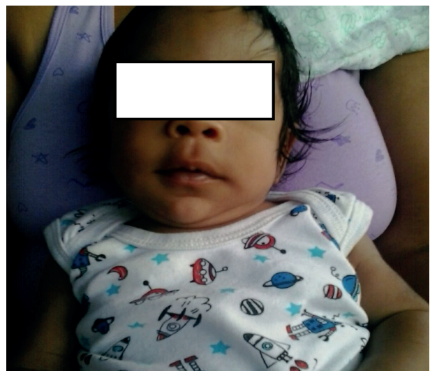
Figuras 1 y 2. Muestran el deterioro progresivo del paciente.