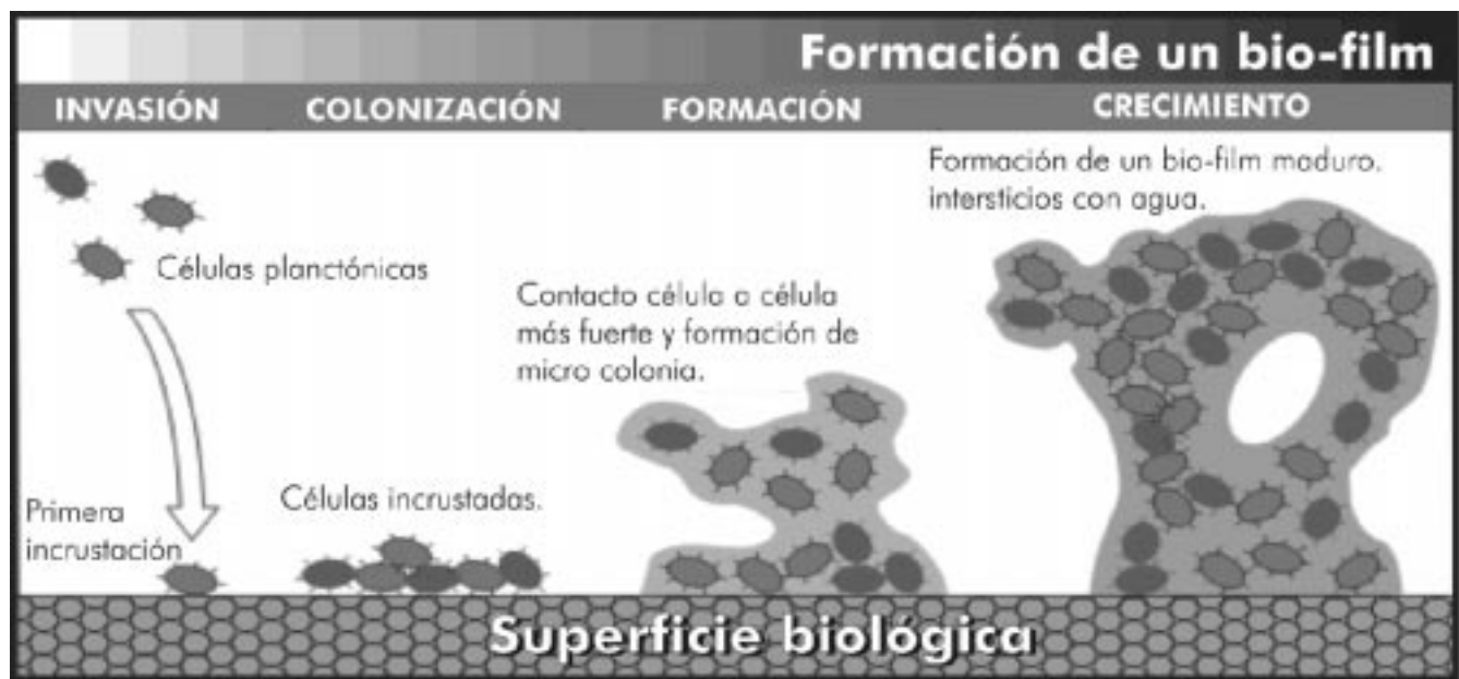
Figura 1. Formación y estructura de un biofilm. Disponible en: URL: www.alientoassist.com/libro/book_2.htm .

El biofilm se forma cuando la bacteria detecta ciertos parámetros ambientales; disminución o aumento de la disponibilidad de nutrientes y de hierro, cambios en la osmolaridad, el pH, la tensión de oxígeno y la temperatura, que disparan la transición de la forma