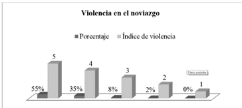
Gráfico No. 1.

Con respecto a los resultados de la aplicación de la encuesta que permite evidenciar el grado de severidad de la violencia durante el noviazgo, los resultados son preocupantes. De las 40 alumnas, el 55%, se encuentra inmersa en una relación violenta, es decir, que ya se sugiere una intervención urgente en razón a que su vida y salud física y mental se encuentran en peligro (en la tabla, valor 5). El 35% está cerca de escalar a una relación violenta porque en sus relaciones sentimentales es frecuente acudir a la violencia (en la tabla, valor 4). El matiz aquí, en las relaciones de abuso severo, radica en que la pareja intenta remediar el acto una vez este lo ha ejecutado. Las relaciones de abuso y primeras señales de violencia fueron relativamente bajas: 8 y 2% respectivamente (en la tabla, valor 3 y 2); mientras que la inexistencia de violencia en la pareja fue nulo.