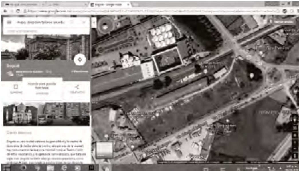
Gráfico 1- ubicación satelital lote bodega acueducto de Bogotá

El otro momento -2018-, ya liquidada la iniciativa del programa “Basura Cero” a pesar de sus resultados (ver Imagen 2), regresó el modelo a los antiguos operadores –ver cuadro- que solo recogen los residuos y lo dejan en el vertedero Doña Juana, atándose al clausulado que les impone deberes limitados, pero no los obliga a dar recursos para un fondo de reposición y cambio del vertedero actual, a otro tipo de tecnología ambiental, ello obedece a la ausencia de una política pública en tal sentido, tal como lo deja claro esta investigación. (Ver Imagen 2)