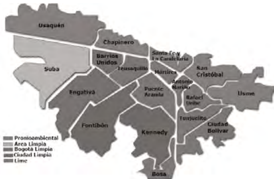
Gráfico 3- Nuevos prestadores de aseo en Bogotá

El Distrito ha llevado varias decisiones bajo el paraguas de las declaratorias de emergencia – 2012-2018, una para crear un sistema novedoso y otra para luego de una lucha de intereses, regresar el manejo al sector privado-Ver figura 3-, y de esta manera tanto unos como otros, no darle cabida al bienestar de las comunidades y menos de crear una política en beneficio del medio ambiente.