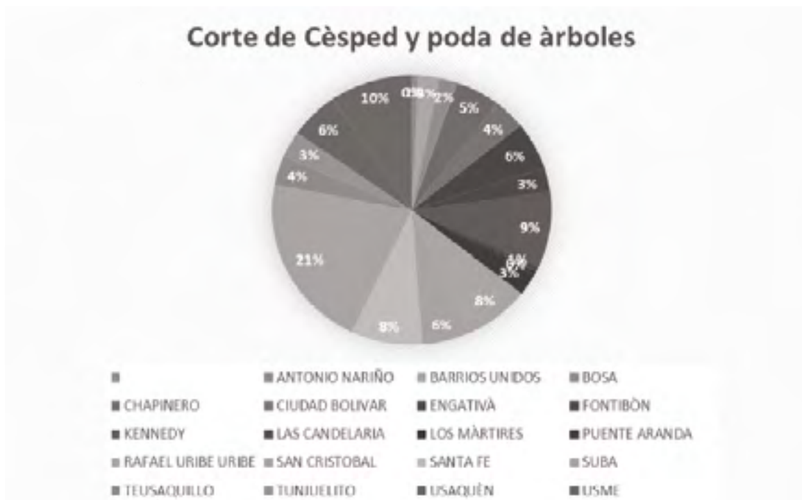
Gráfico 4

Análisis: En la tabla y grafica anterior se observa el promedio por localidades del corte de césped y poda de árboles, donde la localidad que muestra el porcentaje más alto es Suba con un 21%, mientras que el porcentaje más bajo (3%) lo muestran las localidades de Mártires, la Candelaria y Antonio Nariño. (Alcalde Mayor de Bogotá, 2016)