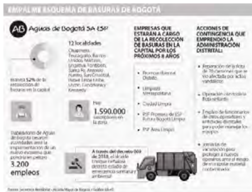
Gráfico 2- Esquema de basuras Bogotá

El otro momento -2018-, ya liquidada la iniciativa del programa “Basura Cero” a pesar de sus resultados (ver Imagen 2), regresó el modelo a los antiguos operadores –ver cuadro- que solo recogen los residuos y lo dejan en el vertedero Doña Juana, atándose al clausulado que les impone deberes limitados, pero no los obliga a dar recursos para un fondo de reposición y cambio del vertedero actual, a otro tipo de tecnología ambiental, ello obedece a la ausencia de una política pública en tal sentido, tal como lo deja claro esta investigación. (Ver Imagen 2)