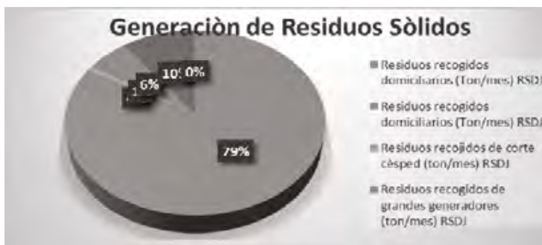
Gráfico 2. Generación de Residuos Sólidos.

Fuente: Interventoría Consorcio Inter Capital Oficio de radicado UAESP: 20166010058912 del 11 de marzo de 2016. Información modificada, respecto del Decreto 548 del 17 de diciembre de 2015. Información aprobada mediante Decreto 227 de 2016.