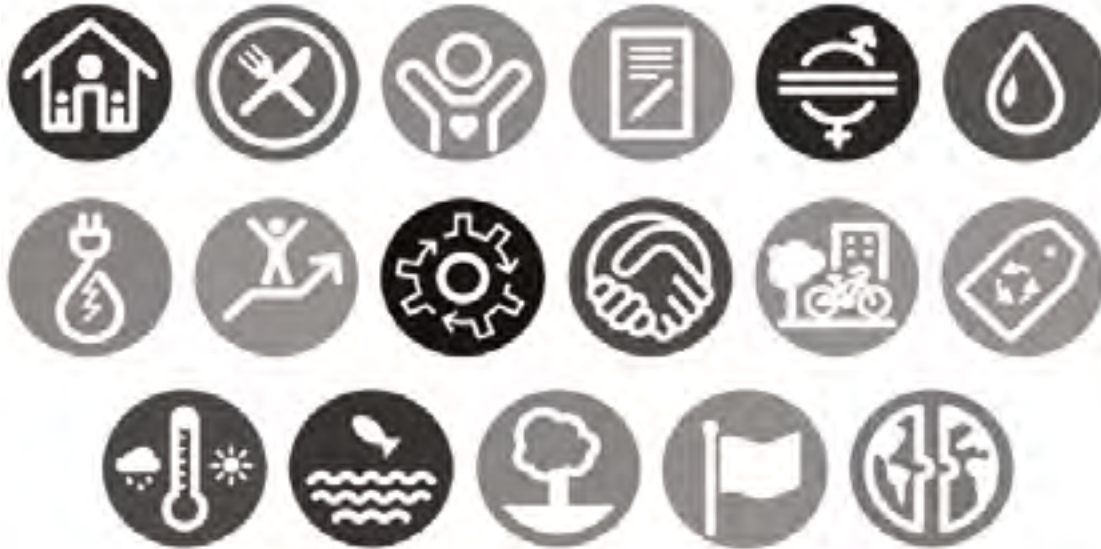
Gráfico 8

Colombia identificó las metas para el cumplimiento de los ODS, adoptada en 193 países; el proyecto trata de 16 grandes apuestas previstas en el documento CONPES 3918, para cumplir con las 169 metas ODS debe designar 30 entidades nacionales para que lideren las acciones hasta el 2030, marcando rutas de desarrollo social y económico para favorecer al medio ambiente. (Departamento Nacional de Planeación, 2018).