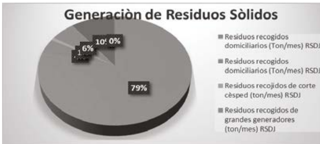
Gráfico 2. Generación de Residuos Sólidos.

Fuente: Interventoría Consorcio Inter Capital Oficio de radicado UAESP: 20166010058912 del 11 de marzo de 2016. Información modificada, respecto del Decreto 548 del 17 de diciembre de 2015. Información aprobada mediante Decreto 227 de 2016.