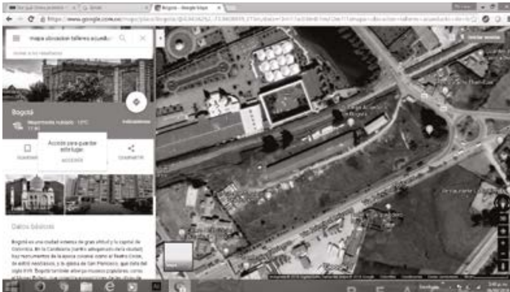
Imagen 1- ubicación satelital lote bodega acueducto de Bogotá

El otro momento -2018-, ya liquidada la iniciativa del programa “Basura Cero” a pesar de sus resultados (ver Imagen 2), regresó el modelo a los antiguos operadores –ver cuadro- que solo recogen los residuos y lo dejan en el vertedero Doña Juana, atándose al clausulado que les impone deberes limitados, pero no los obliga a dar recursos para un fondo de reposición y cambio del vertedero actual, a otro tipo de tecnología ambiental, ello obedece a la ausencia de una política pública en tal sentido, tal como lo deja claro esta investigación. (Ver Imagen 2)