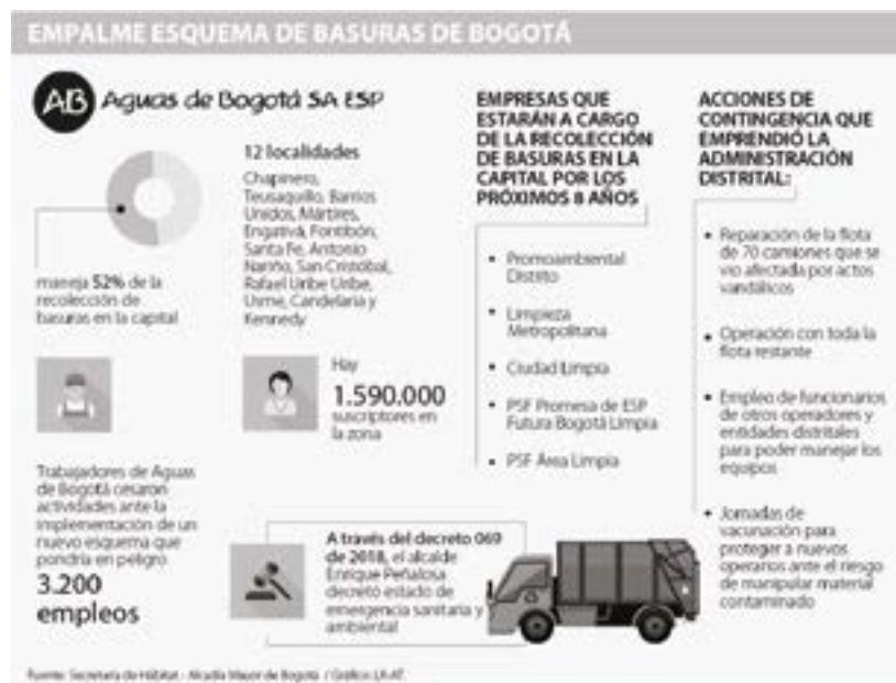
Imagen 2- Esquema de basuras Bogotá

El otro momento -2018-, ya liquidada la iniciativa del programa “Basura Cero” a pesar de sus resultados (ver Imagen 2), regresó el modelo a los antiguos operadores –ver cuadro- que solo recogen los residuos y lo dejan en el vertedero Doña Juana, atándose al clausulado que les impone deberes limitados, pero no los obliga a dar recursos para un fondo de reposición y cambio del vertedero actual, a otro tipo de tecnología ambiental, ello obedece a la ausencia de una política pública en tal sentido, tal como lo deja claro esta investigación. (Ver Imagen 2)