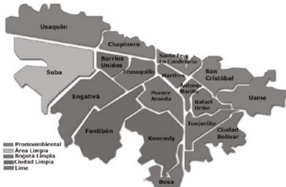
Imagen 3- Nuevos prestadores de aseo en Bogotá

El Distrito ha llevado varias decisiones bajo el paraguas de las declaratorias de emergencia – 2012-2018, una para crear un sistema novedoso y otra para luego de una lucha de intereses, regresar el manejo al sector privado-Ver figura 3-, y de esta manera tanto unos como otros, no darle cabida al bienestar de las comunidades y menos de crear una política en beneficio del medio ambiente.