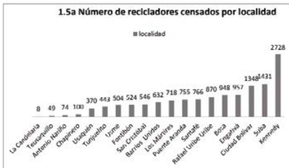
Grafico 1 -Censo de poblacion recicladora en Bogotá